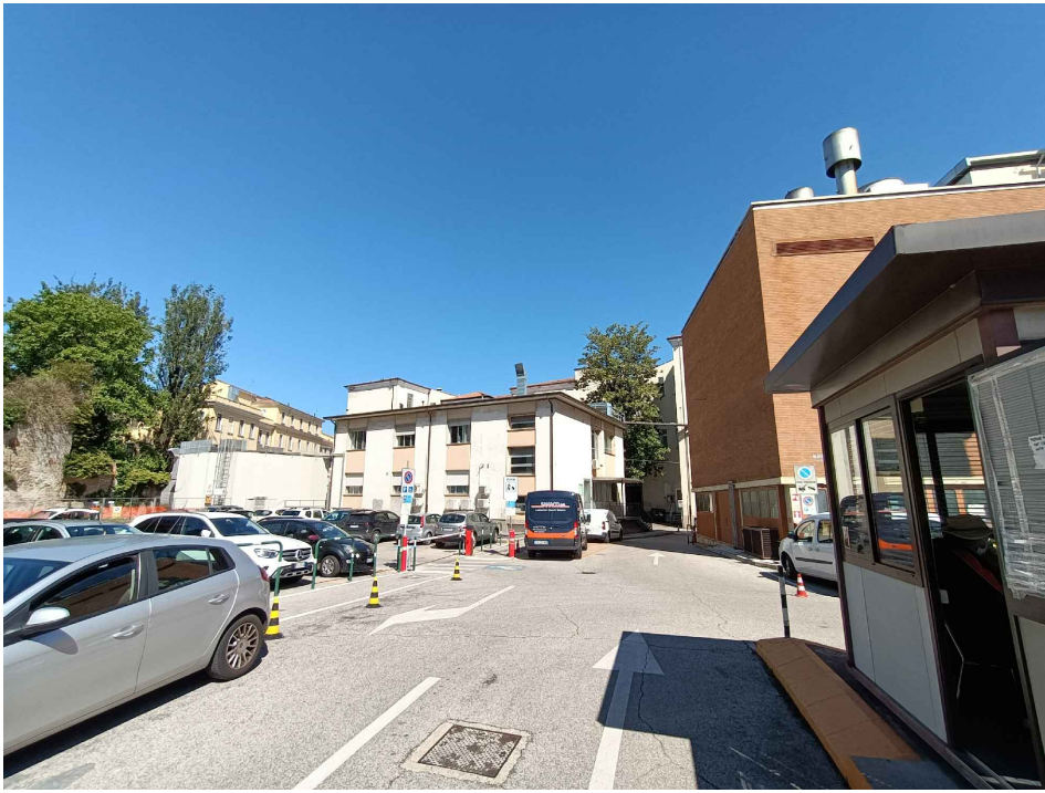
Vista dell'edificio sullo sfondo