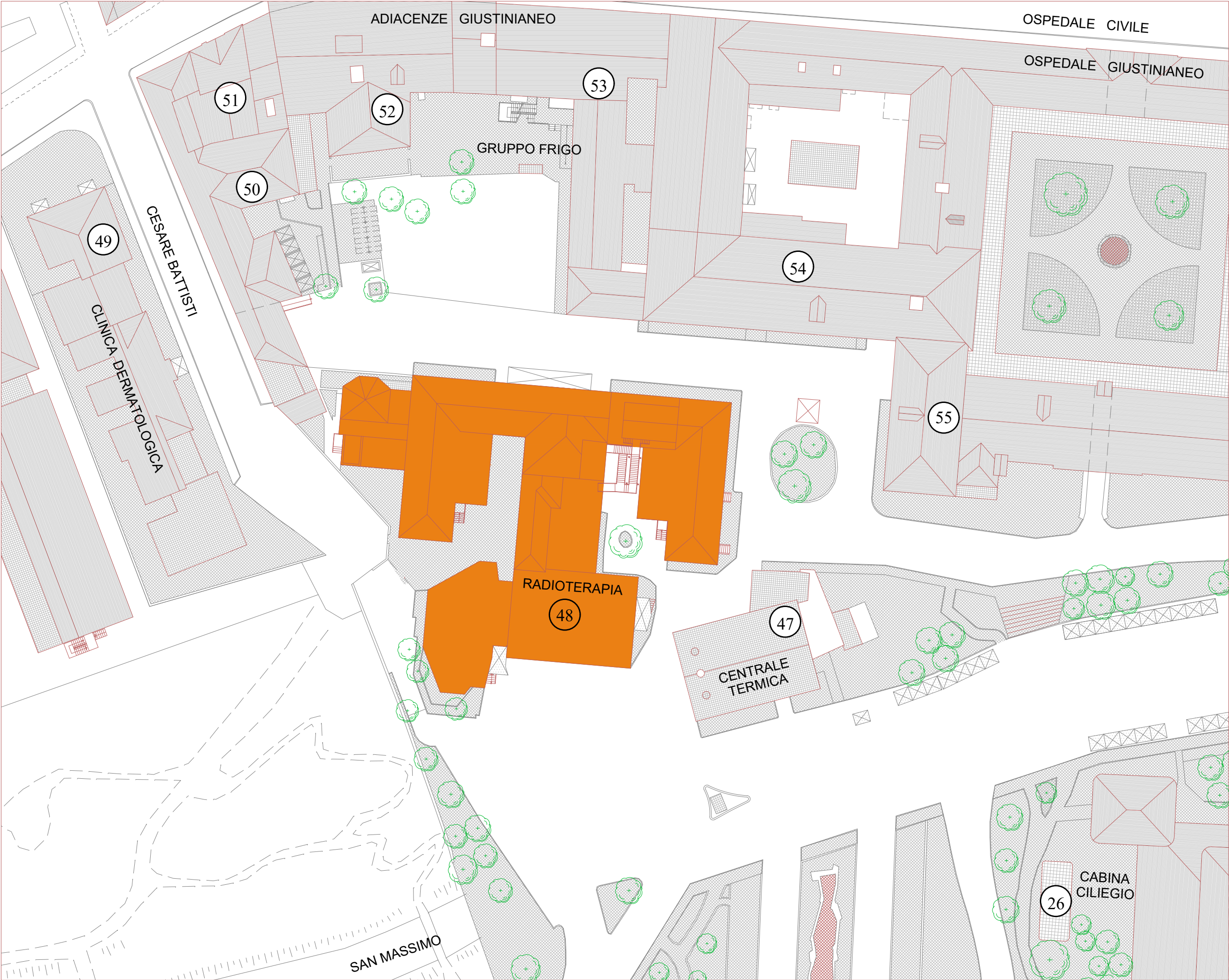
Planimetria di inquadramento