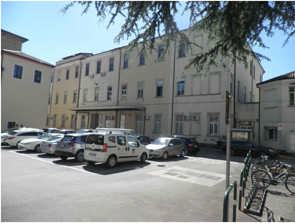
Vista esterna dell'edificio e del piazzale