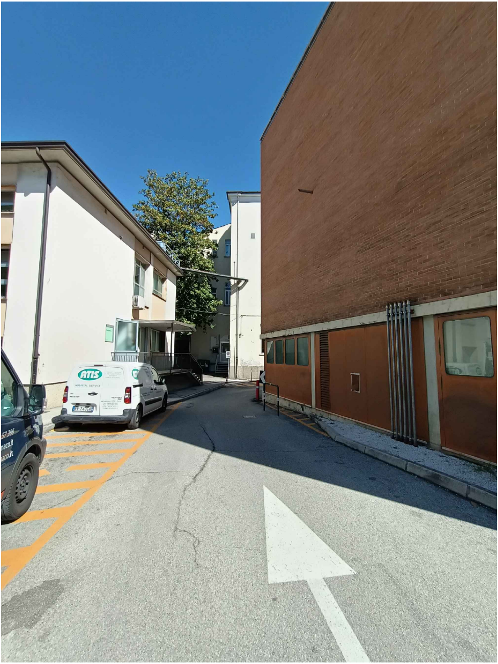
Vista esterna dell'edificio