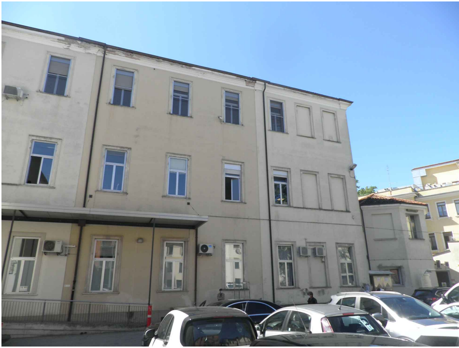
Vista esterna dell'edificio e del piazzale