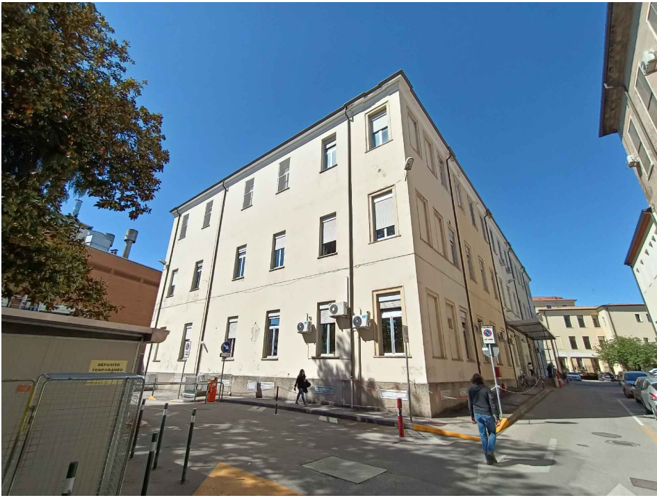
Vista dei prospetti