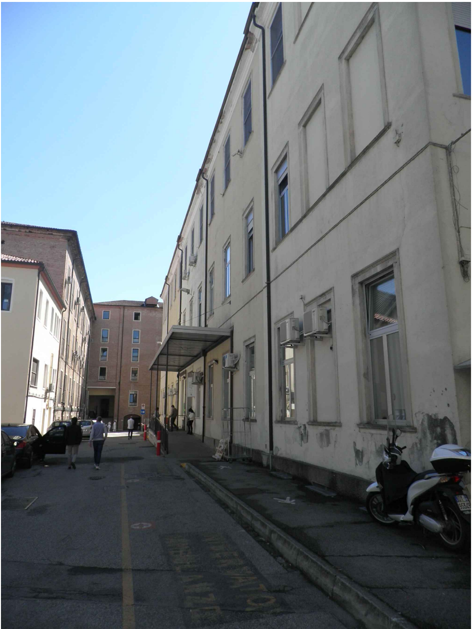
Vista del prospetto nord